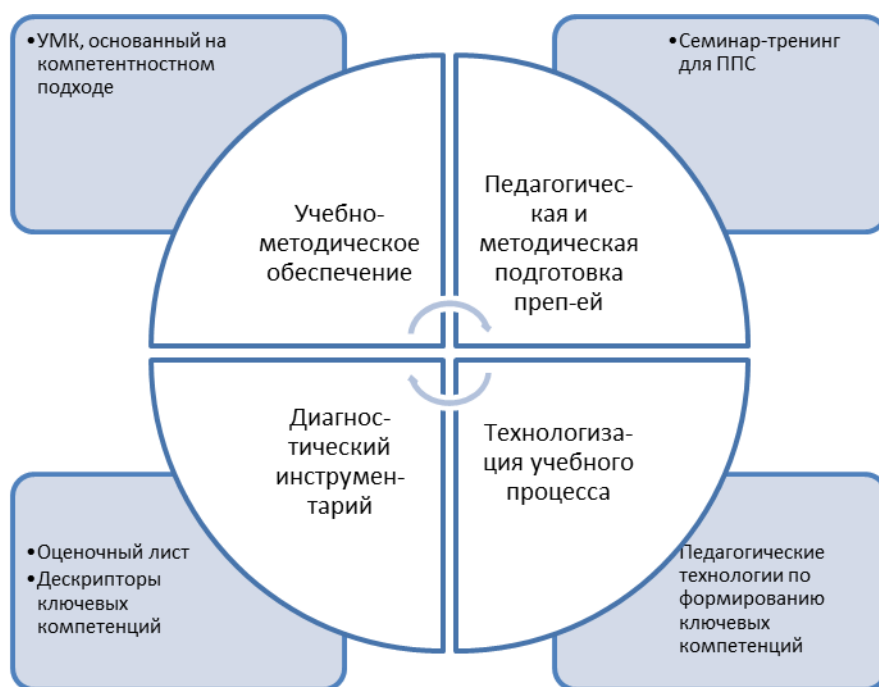
Рис. 2. Педагогические условия формирования ключевых компетенций.

В целях обеспечения эффективности процесса формирования ключевых компетенций нами были выявлены и разработаны педагогические условия (Рис.2) - «совокупность взаимосвязанных и взаимообусловленных обстоятельств процесса обучения, являющихся результатом целенаправленного отбора, конструирования и применения элементов содержания, методов или приемов, а также организационных форм обучения для достижения определенных дидактических целей» (А.А. Андреев).