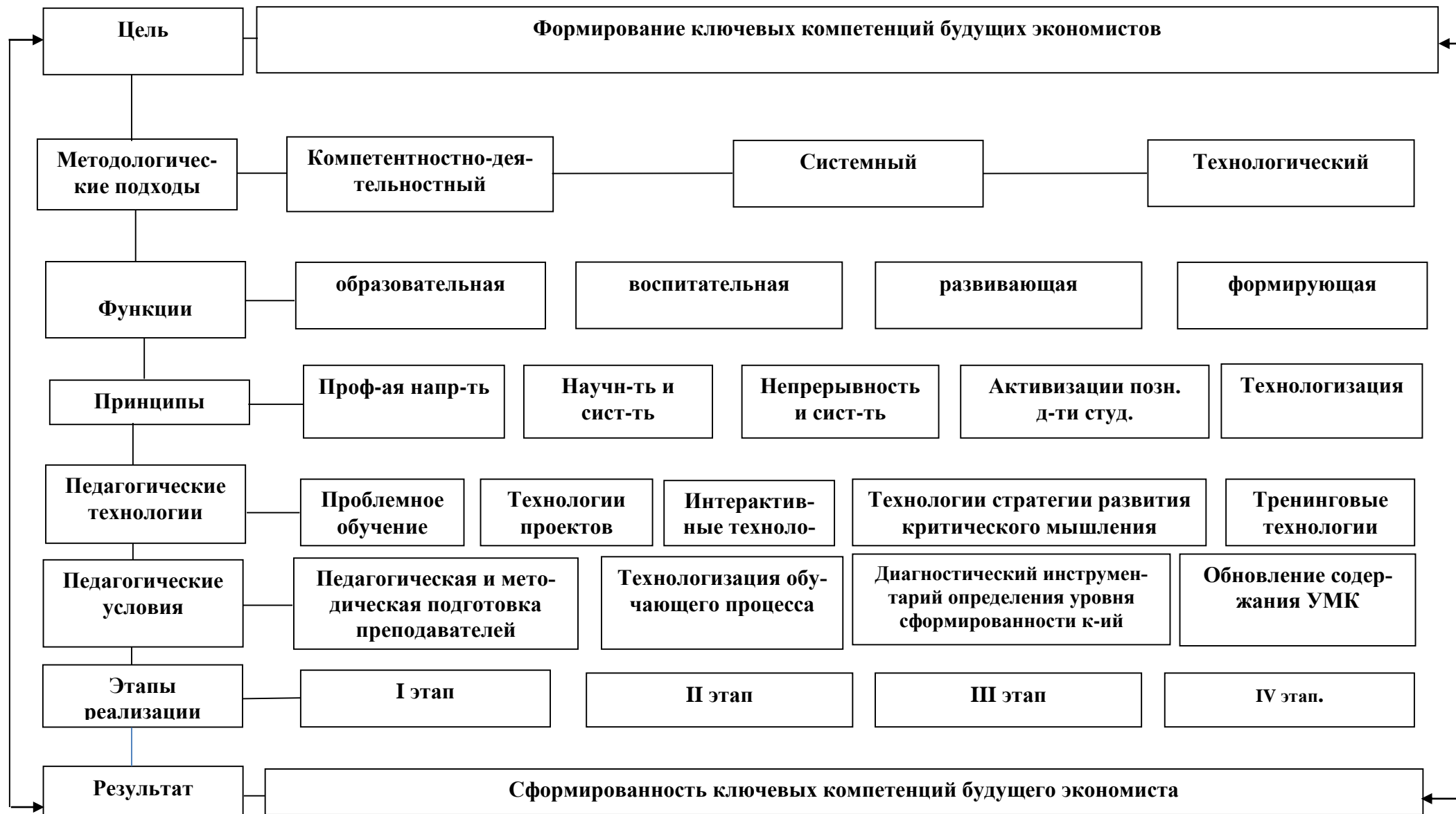
Рис. 4. Структурно-содержательная модель формирования ключевых компетенций будущего экономиста