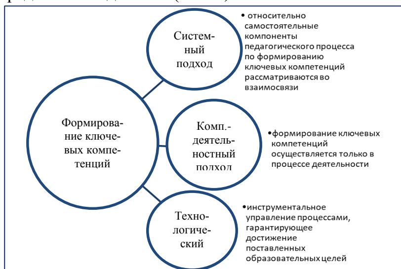
Рис. 3. Проекция методологических подходов на предмет исследования.

Далее продемонстрируем проекцию выбранных нами методологических подходов на предмет исследования (Рис. 3).